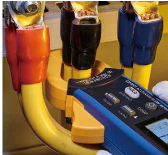
간격이 좁은 굵은 선과 더블배선도 손쉽게 클램핑